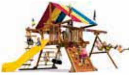
Flatpack, residential, commercial

Rainbow Play Systems Int. 25840 IH-10 West, Suite 1 Boerne, TX 78006 (United States) Telefon +1/210/764-13 75 Telefax +1/210/698-38 43 E-Mail alberto@rps-international.com Internet www.rainbowplay.com