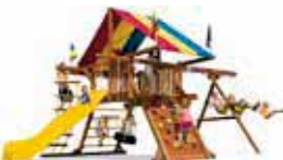
Flatpack, residential, commercial

25840 IH-10 West, Suite 1 Boerne, TX 78006 (United States) Telefon +1/210/764-13 75 Telefax +1/210/698-38 43 E-Mail alberto@rps-international.com Internet www.rainbowplay.com